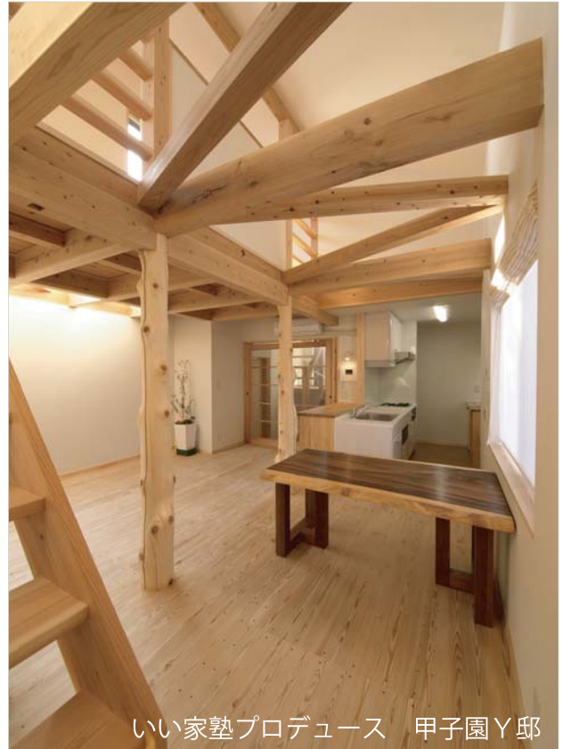
いい家塾プロデュース 甲子園Y邸

FAX: 06-6773-3420 e-mail: info@e-iejuku.jp 振込先: ゆうちょ銀行 せのりウキウ店 当座0222227 イイヱジユク 郵便振替 00980-2-22227 イイヱジユク